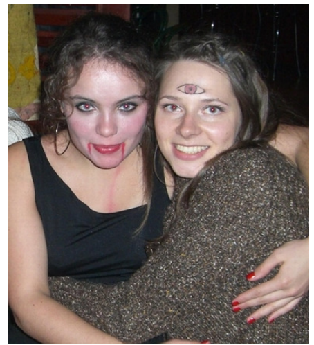
↑ Justina su Vita be nerimo linksmi nusiteikusios Halloween'o šventimui su JVK ☺

Norintys pasimokyti, padiskutuoti ir gerai praleisti laiką su jvk'iečiais registruokitės: volungee@yahoo.com .